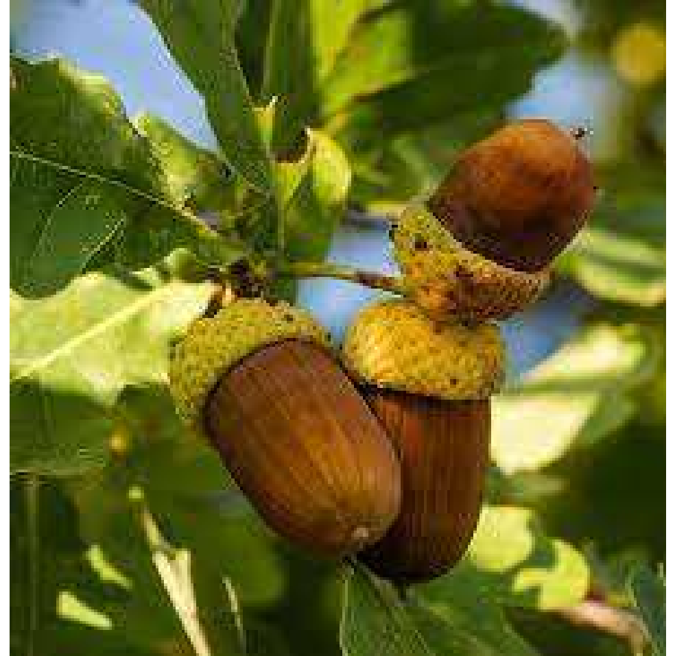
UN G LAND