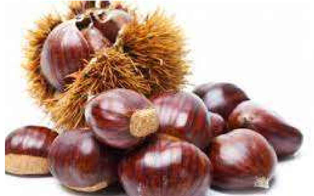
UNE C HÂTAIGNE

On peut manger les châtaignes mais pas les marrons