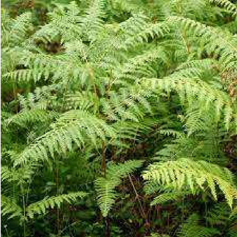
UNE F OUGÈRE