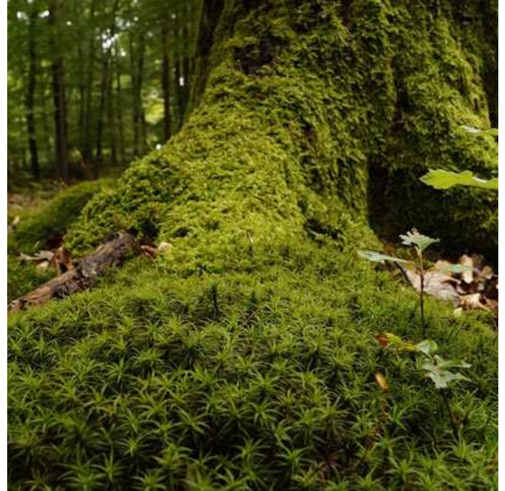
LA M OUSSE