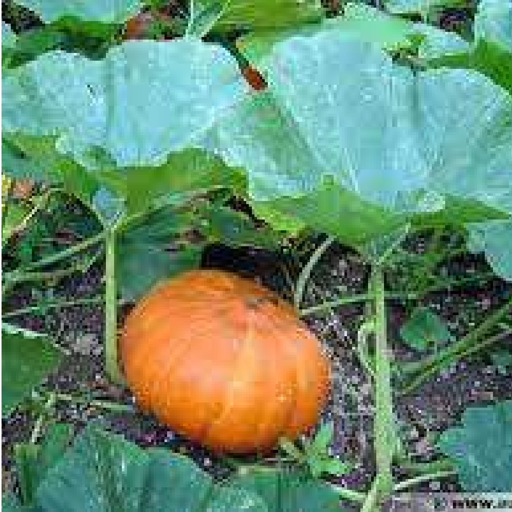
UN P OTIRON