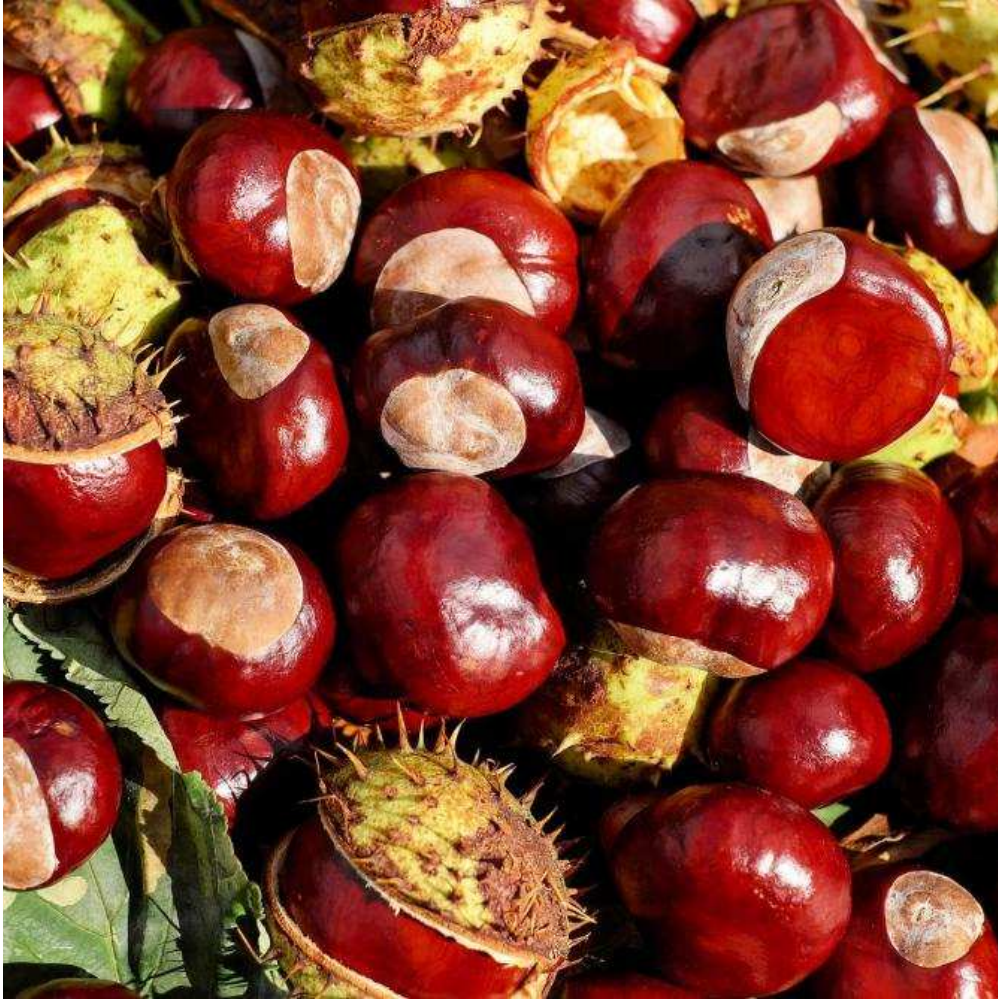
UN M ARRON