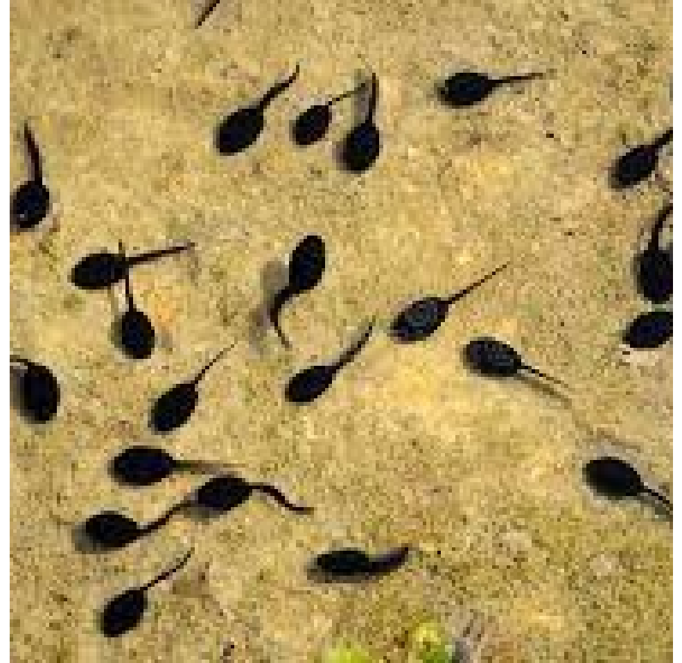
DES T ÊTARDS