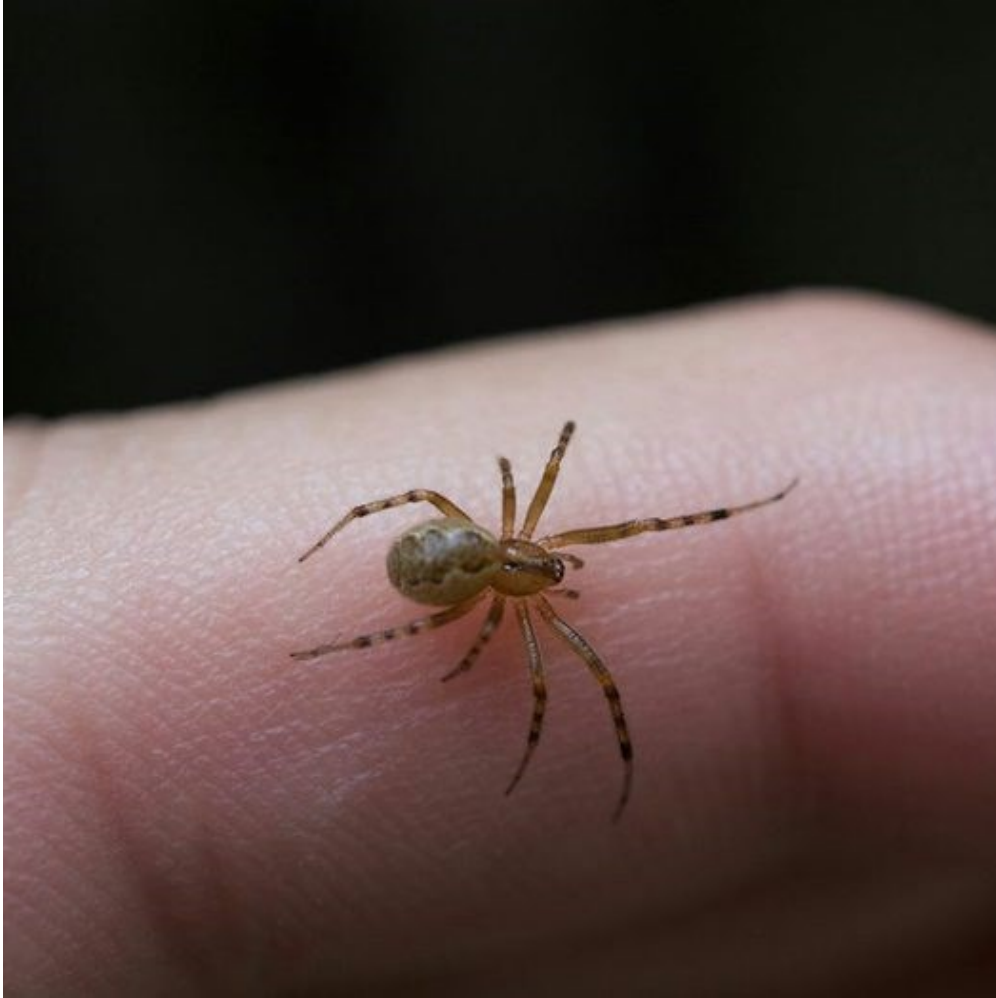
UNE A RAIGNÉE