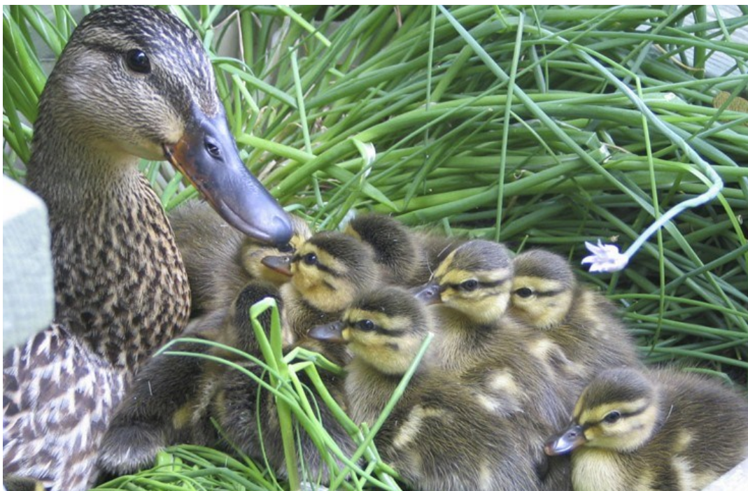
UNE C ANE ET SES C ANETONS