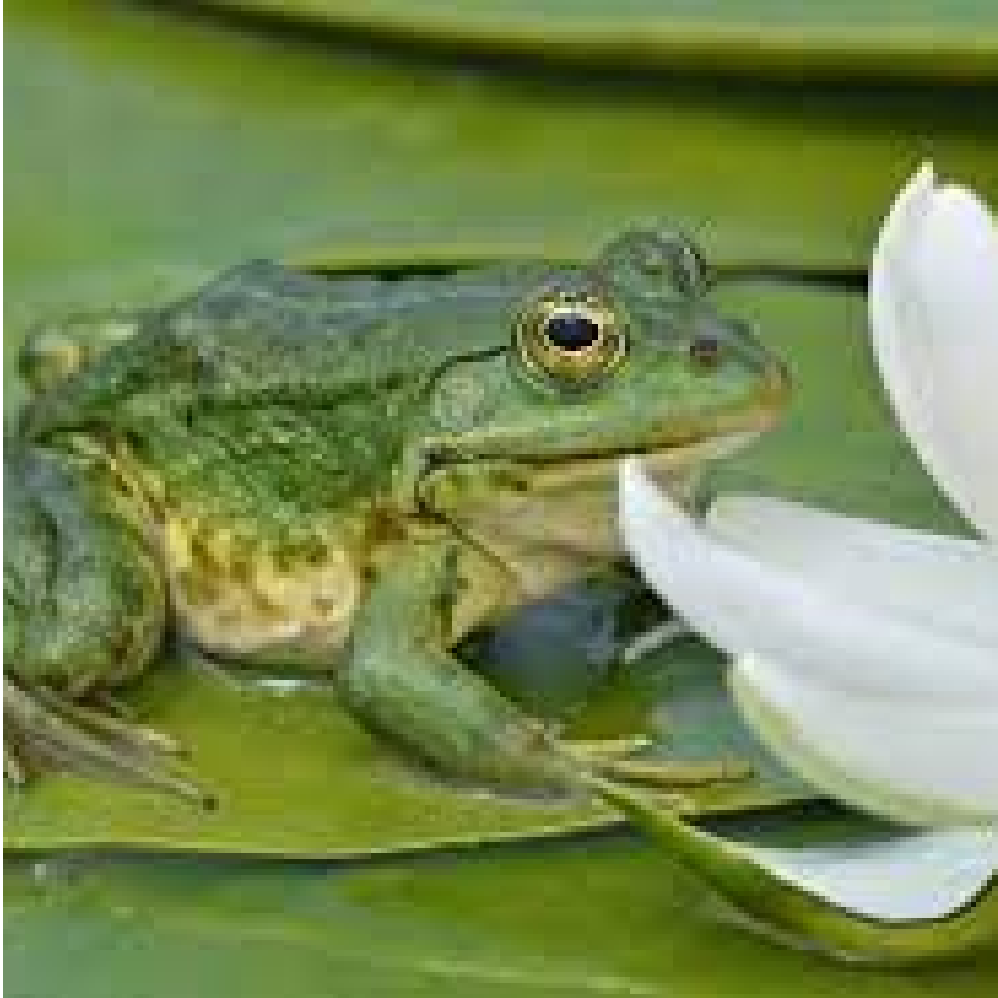
UNE G RENOUILLE