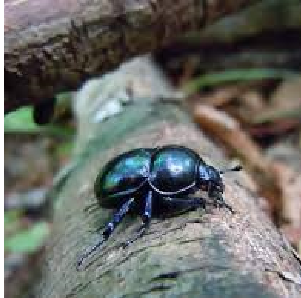
UN S CARABÉE