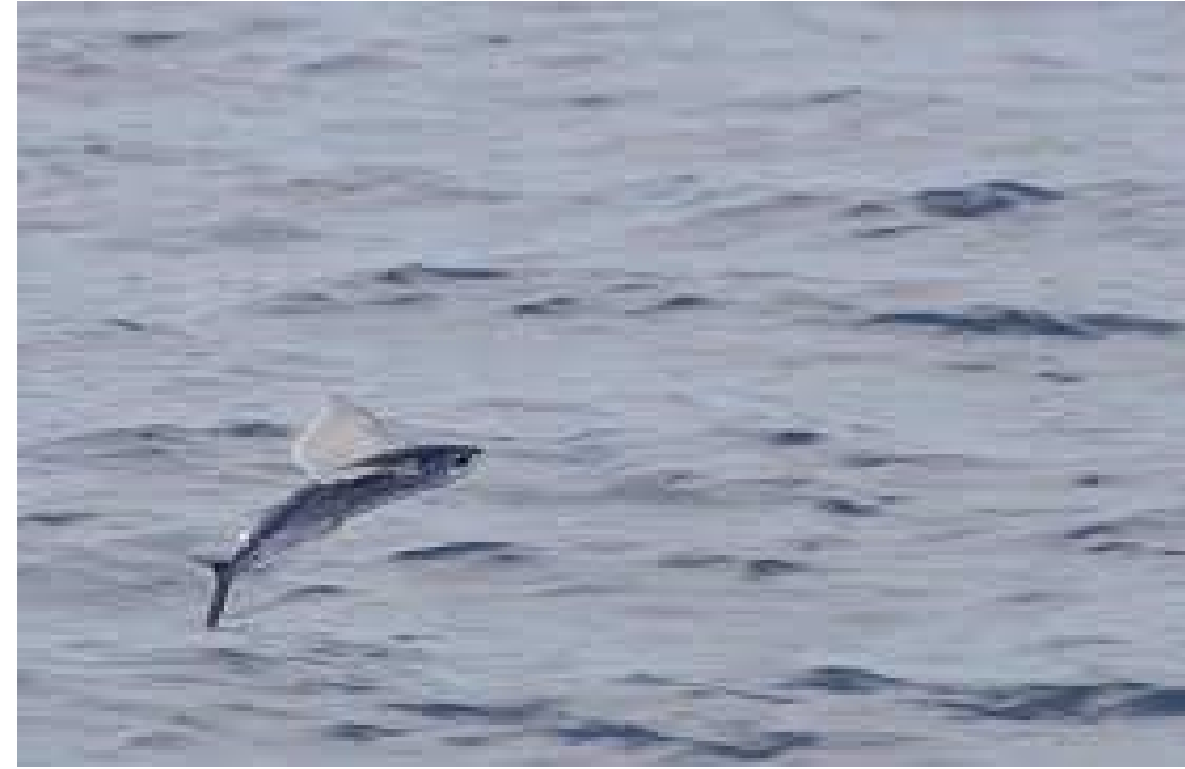
UN P OISSON VOLANT