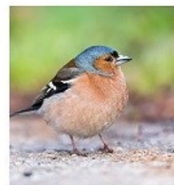
Pinson des arbres