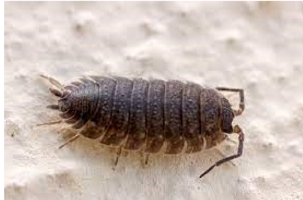
UN C LOPORTE