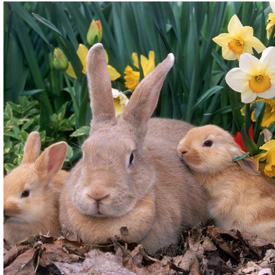
UNE L LAPINE ET SES L LAPEREAUX