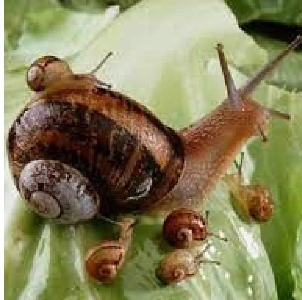
DES E SCARGOTS