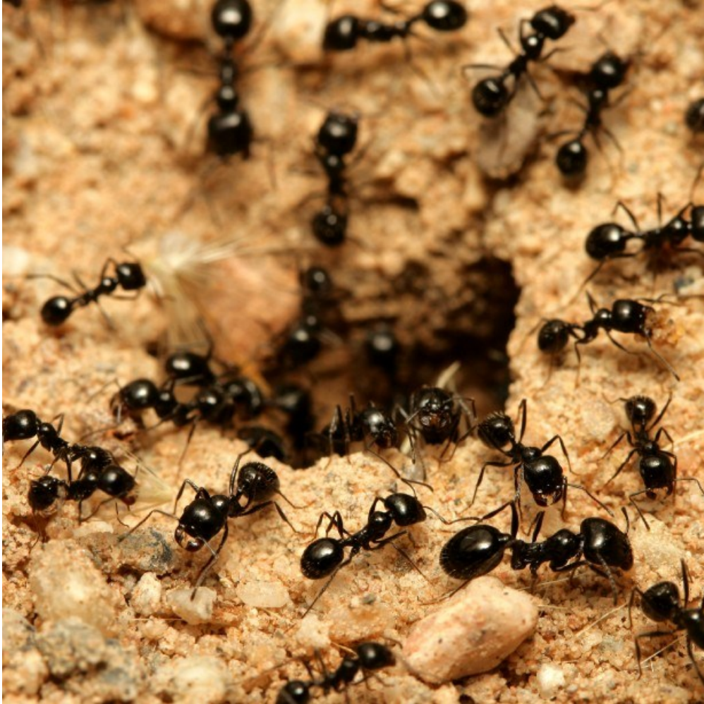
DES F OURMIS