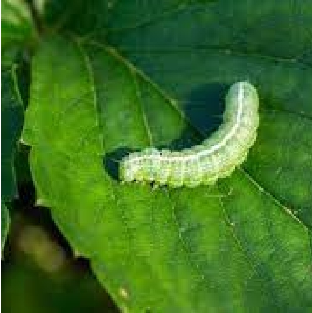
UNE C HENILLE