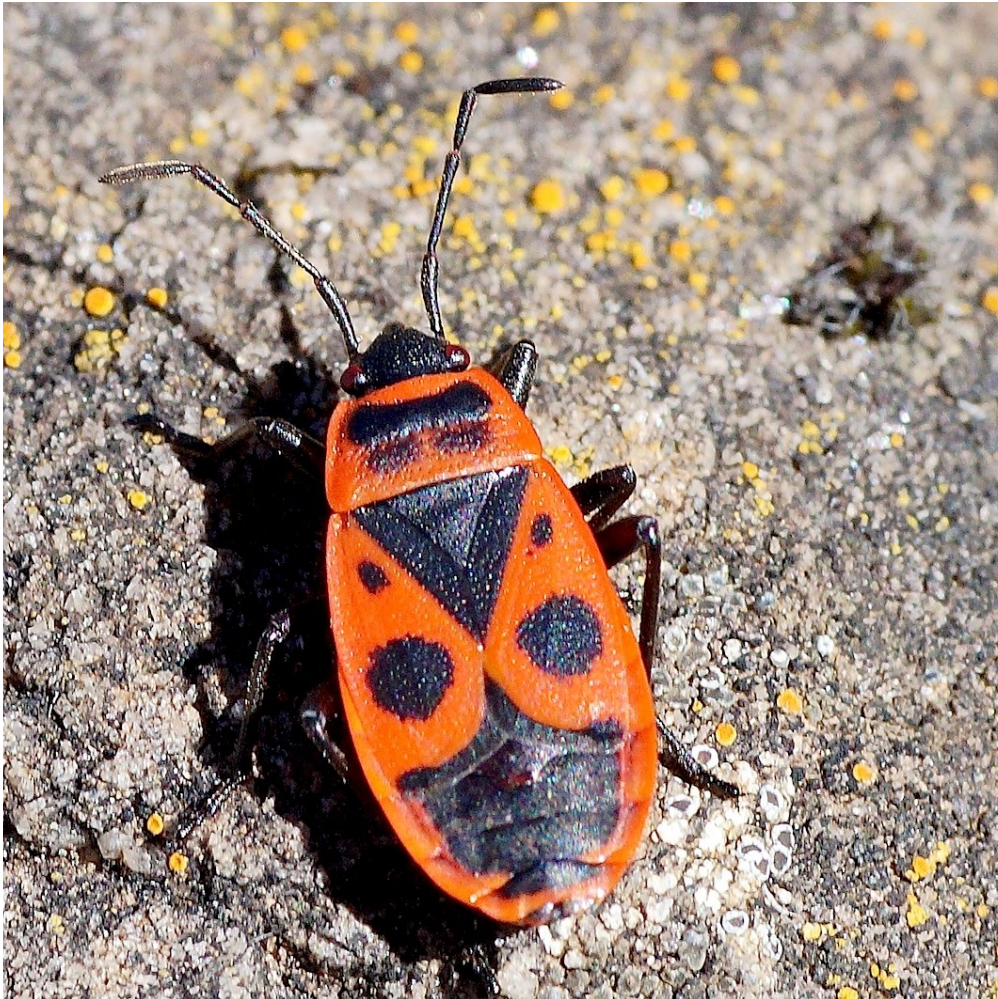
UNE P UNAISE GENDARME