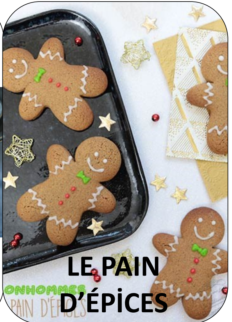
LE PAIN D'ÉPICES