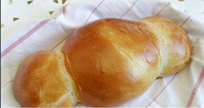
LA BRÏOCHE (ou la coquille)