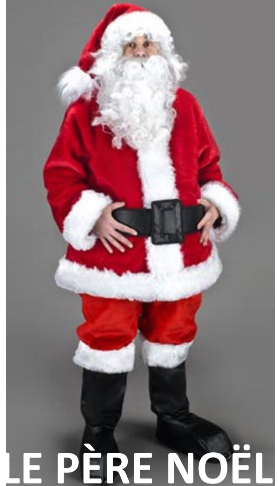
LE PÈRE NOËL