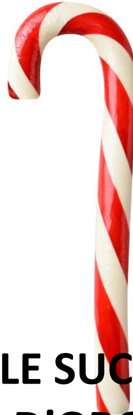
LE SUCRE D'ORGE