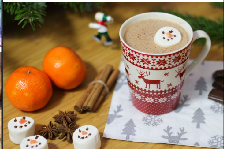
LE CHOCOLAT CHAUD et LES CLÉMENTINES