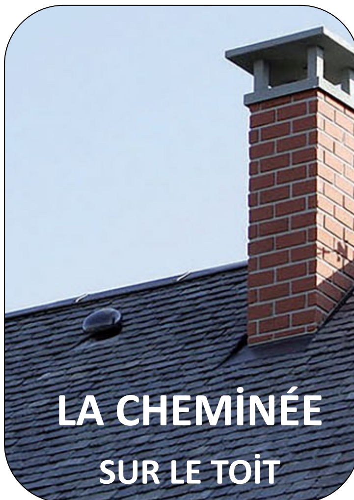
LA CHEMINÉE SUR LE TOIT