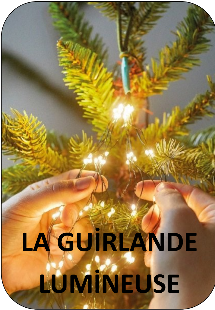
LA GUIRLANDE LUMINEUSE