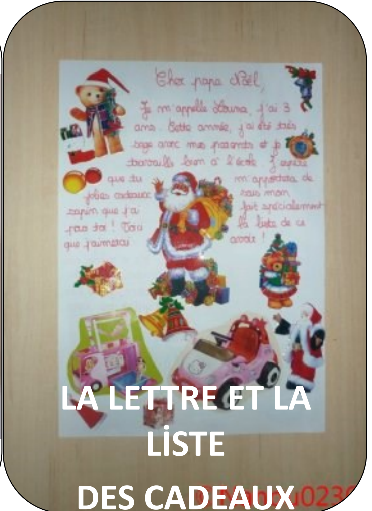
LA LETTRE ET LA LISTE DES CADEAUX