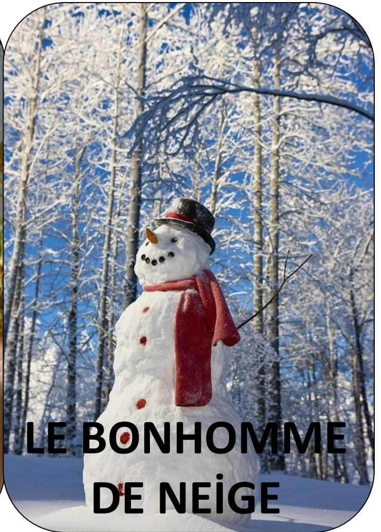
LE BONHOMME DE NEIGE