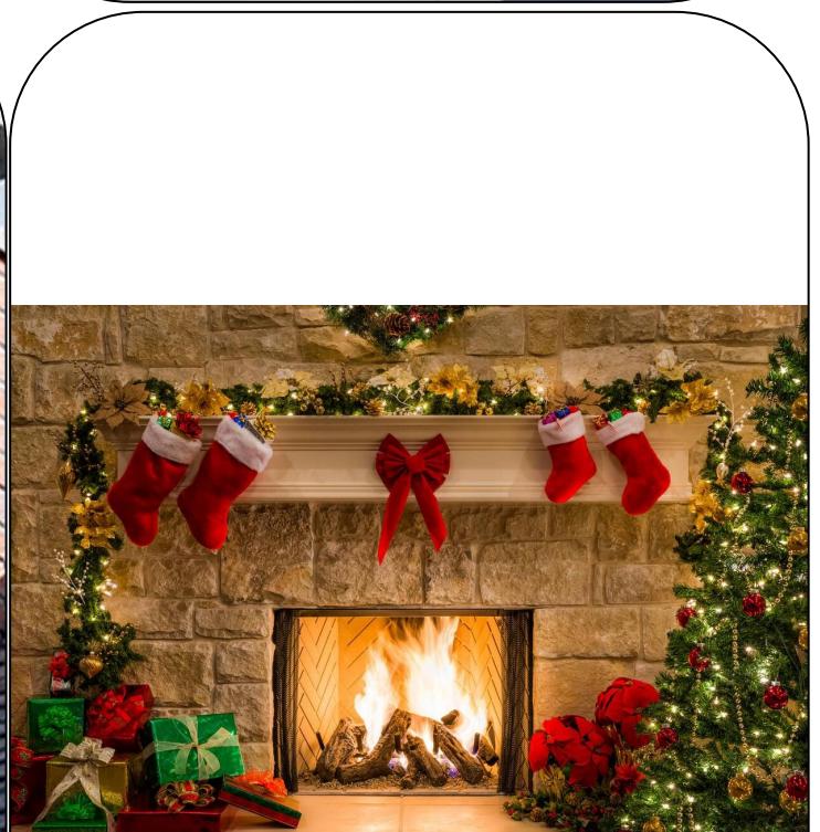
LA CHEMINÉE DANS LA MAISON