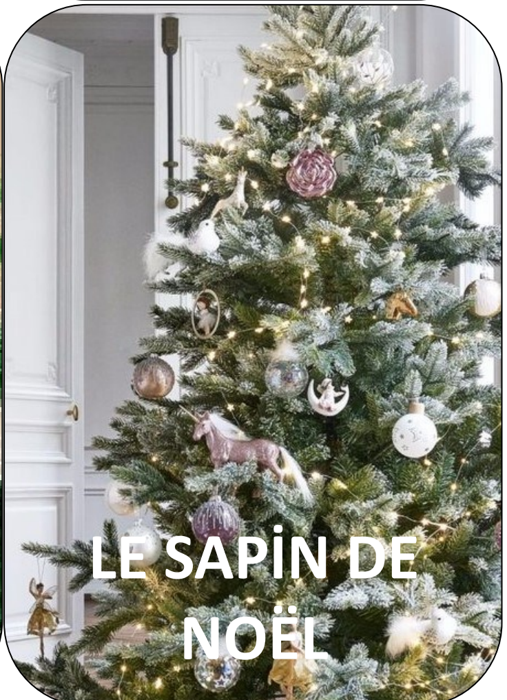
LE SAPIN DE NOËL